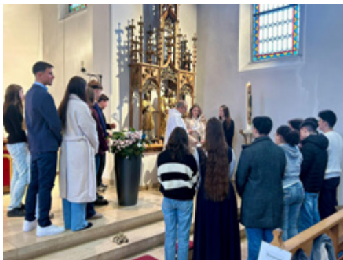
Taufe von Amorella mit den Firmlingen